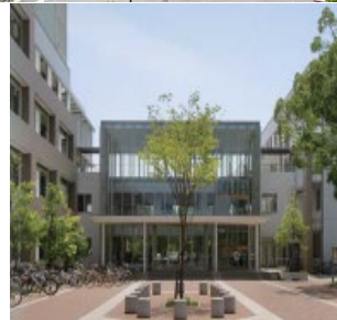
三重大学国際交流センター