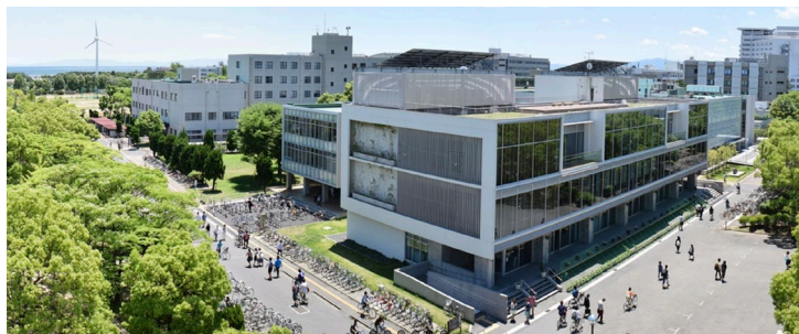
三重大学上浜キャンパス